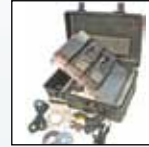
Zubehörsatz für tragbares MicroDock II-System