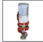
Wandhalterung für Kalibriergas