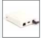
Netzwerk-Kommunikationsgerät mit USB

Für eine vollständige Zubehörliste wenden Sie sich bitte an BW Technologies by Honeywell.