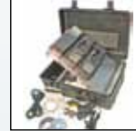
Kit de système portable MicroDock II