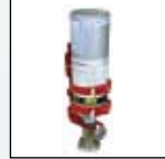
Montage mural pour gaz d'étalonnage