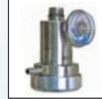
Régulateur de débit à la demande