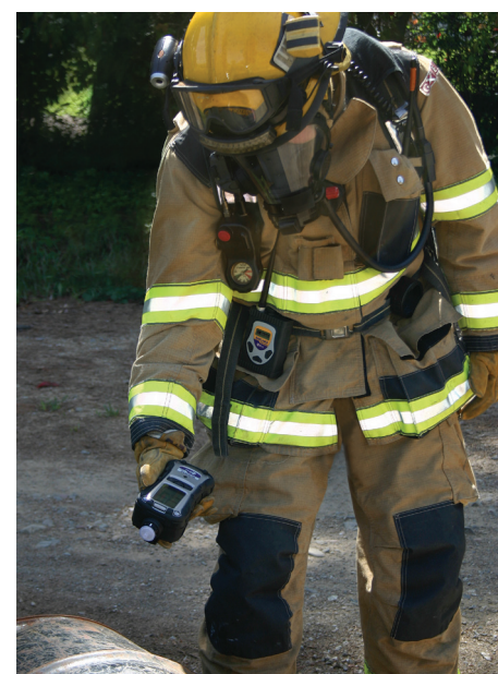
MultiRAE Pro avec un réseau sans fils RAELink3 utilisée pour détecter les fûts potentiellement dangereux